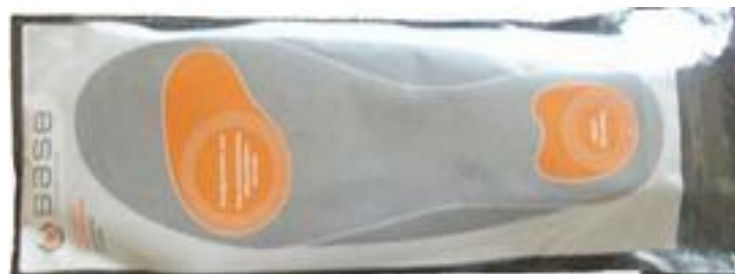
Art. 1010 in blister