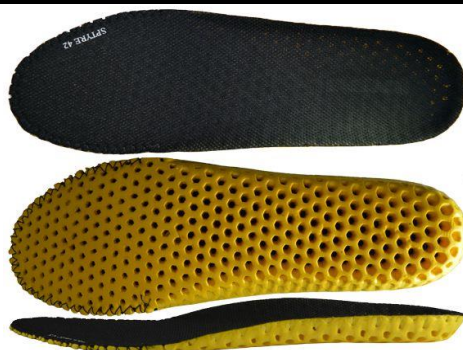
Art. 2424-2 con cucitura antistatica sul bordo frontale