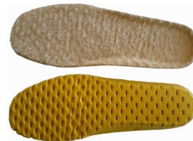
Art. 2424-2 con tessuto lana poliestere