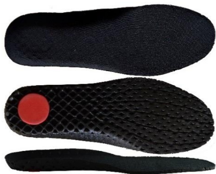
Art. 2824-1 con antischock Poron